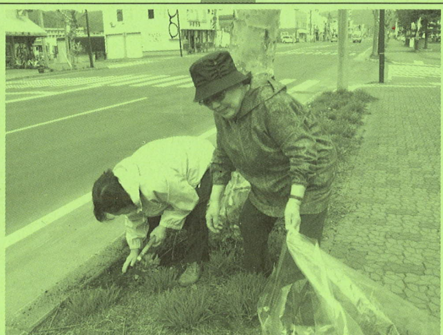
◆花壇の除草ボランティア