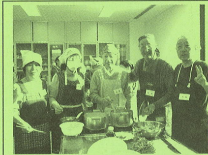
◆料理教室（仕上がりは上出来）