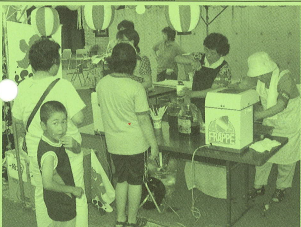
◆三楽荘・ことぶき荘夏まつり販売ボランティア