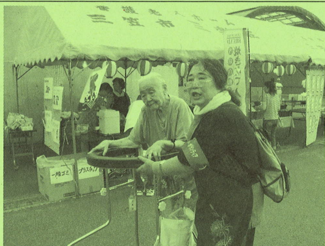
◆三楽荘・ことぶき荘夏まつり介助ボランティア

なお、参加・活動されている方々からの体験談などを頂いていますので紹介させていただきます。