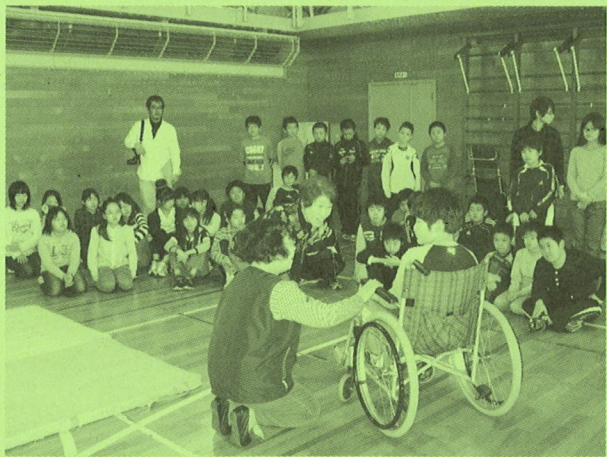
◆三笠小学校 福祉についての学習(車椅子)