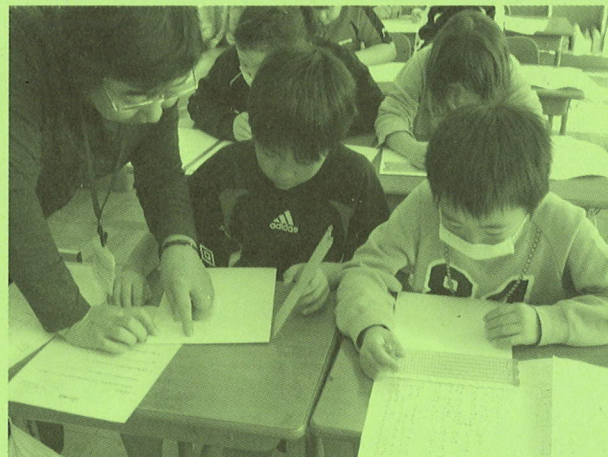
◆三笠中学校 福祉交流学習(点字)