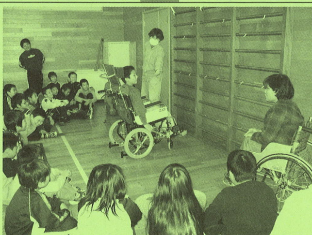
◆三笠小学校 福祉についての学習(車椅子)