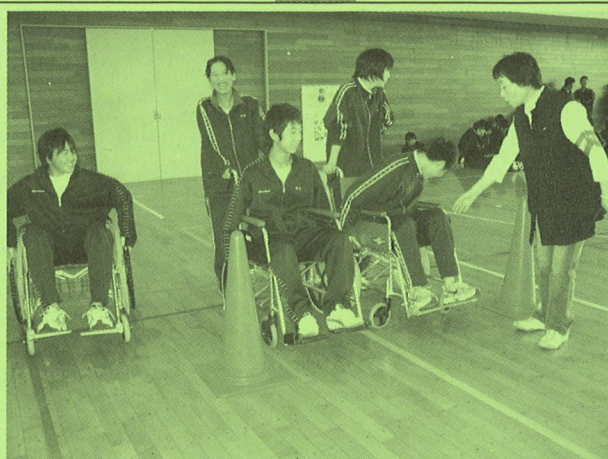
◆三笠中学校 福祉交流学習(車椅子)