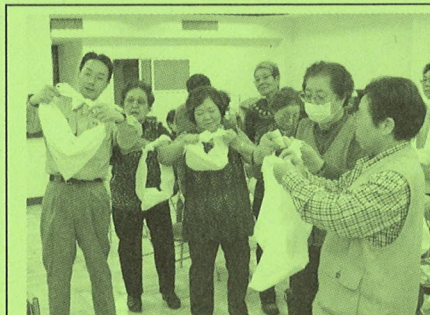
◆ボランティアスクールで実践を中心に取り組む皆さん