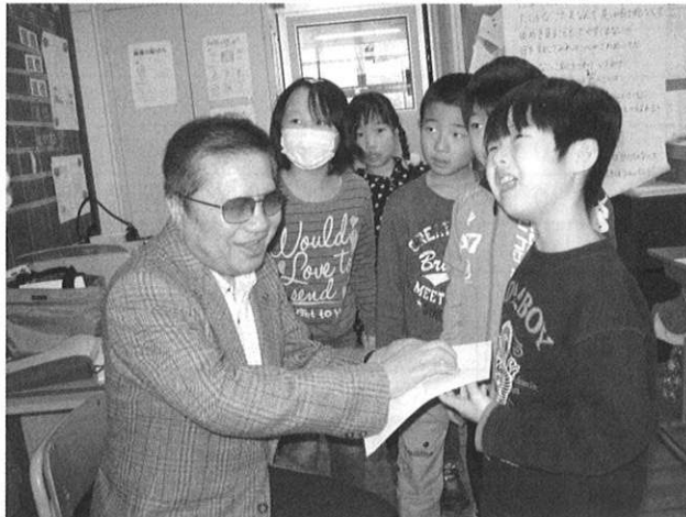
◆三笠小学校 福祉についての学習（点字）