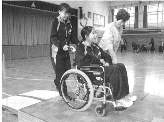
◆三笠中学校 福祉交流学習（車椅子・アイマスク）