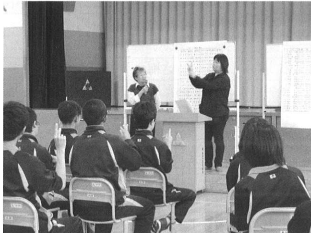
◆三笠中学校 福祉交流学習（手話）