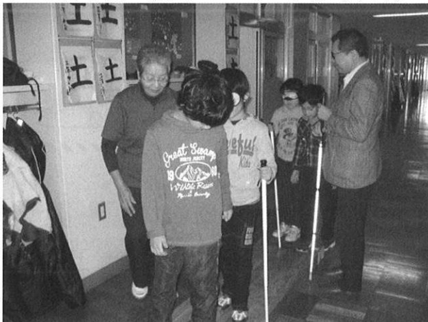
◆三笠小学校 福祉についての学習（アイマスク）