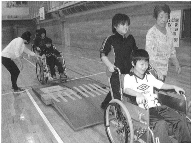
◆三笠小学校 福祉についての学習（車椅子）