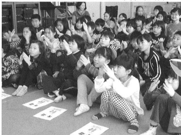
◆三笠小学校 福祉についての学習（手話）