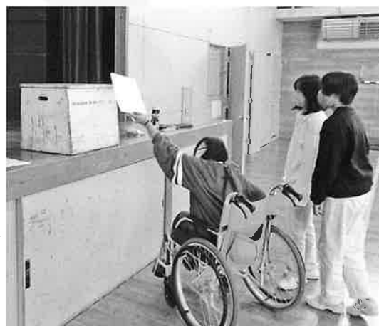
三笠小学校 6年生 車椅子→