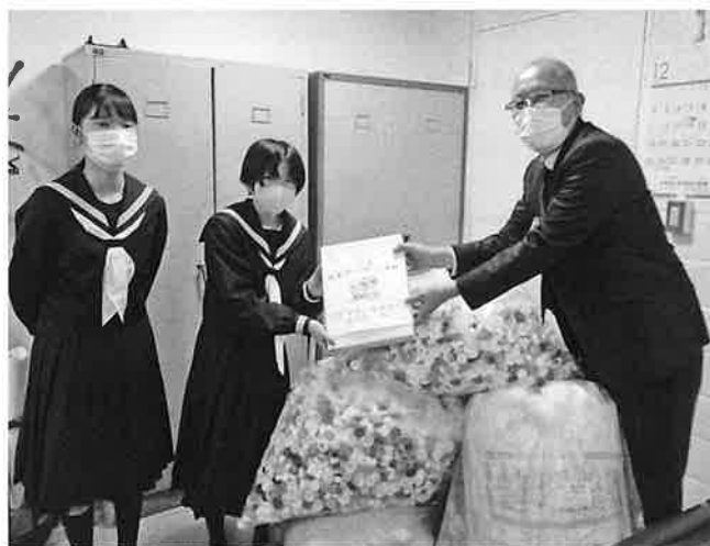
三笠中学校生徒会より