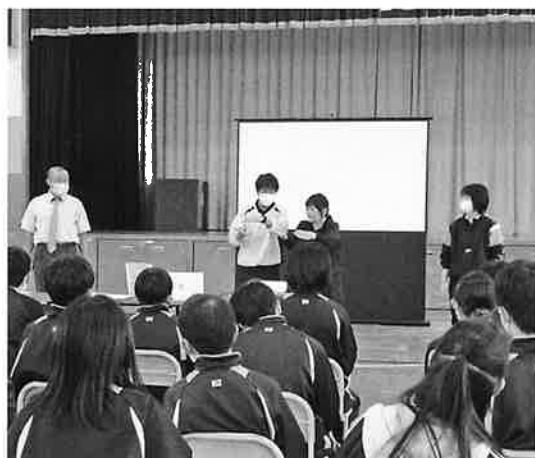
←三笠中学校 1年生 手話