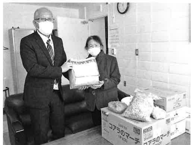
JAいわみざわ農協女性部三笠支部より

個人でも団体でも受け付けております。環境保全やリサイクルも兼ねて集めてくださりますよう、よろしくお願ひします。