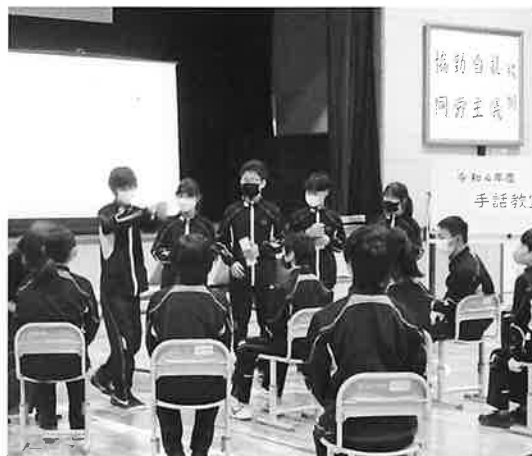
萱野中学校 点字体験→