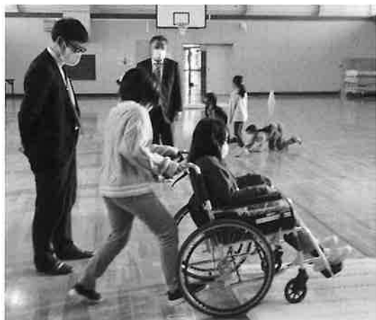
←岡山小学校 3年生 車椅子