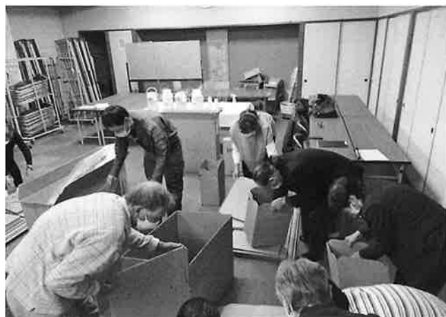
「楽しさを伝える理科」の様子