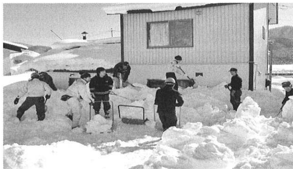
天理教「ひのきしん隊」南空知支部！！