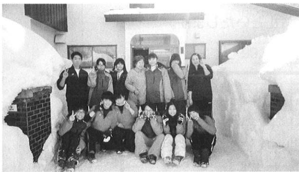
三笠高校地域連携部！！