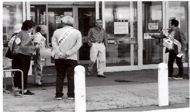
【街頭募金活動の様子】