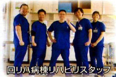
回リハ病棟リハビリスタッフ

当病棟の入院患者さんの平均年齢は約80歳と高齢の方が多いのが特徴的です。その為一人ひとりの状態や体力に合わせて無理のない範囲でリハビリを行います。