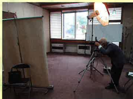
【昨年の撮影の様子】