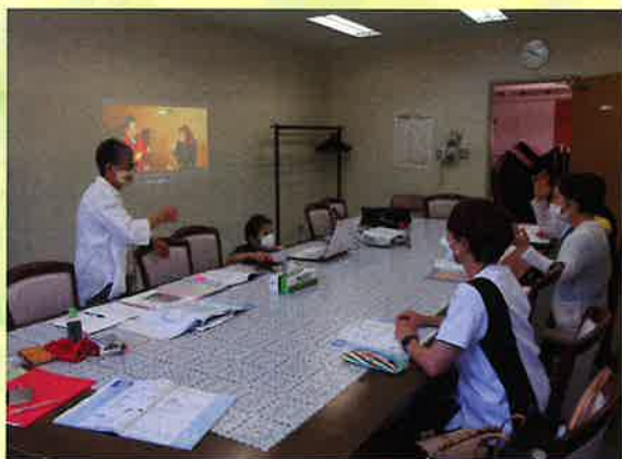
【手話講習会での様子】

また、7月18日萱野連合町内会主催の「萱野中学校避難場所宿泊体験」では、災害時における簡単な手話の講習会を行いました。