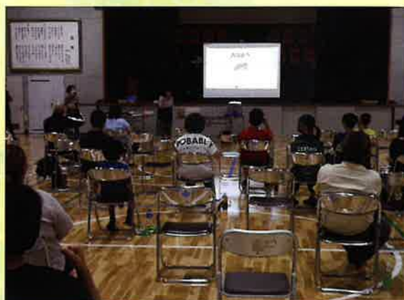
【萱野連合町内会防災訓練での様子】