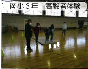
岡小3年 高齢者体験