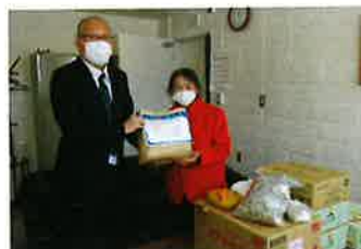
いわみざわ農協様

北海道コカ・コーラボトリング(株)岩見沢販売課からはアクエリアスなどの清涼飲料水、JAいわみざわ農協女性部三笠支部からは新品のタオルなどが寄贈されました。清涼飲料水は、まつばの杜、三葉保育所、児童館、かざぐるま、なかまど共同作業所へ、タオルは福祉施設へお届けしました。