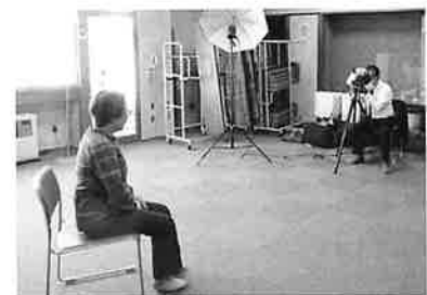
昨年の撮影の様子

自分らしい写真を撮影するために、好きなスタイル(髪型、服装など)でお越しください。